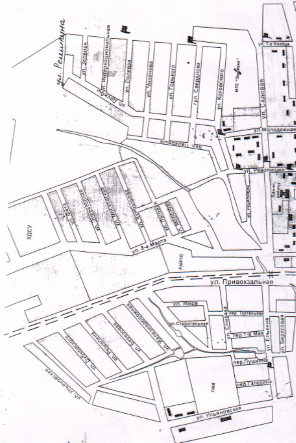
Схема размещения мест (площадок) накопления твердых коммунальных отходов, расположенных на территории городского поселения Змиевка